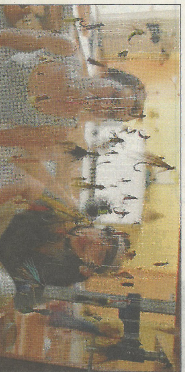
ELLES VOIENT... PRESQUE. Une collection de mouches de peche sera également présentée dans le musée éphémère.

Un art partagé. Trois étudiants de l'Ensa de Limoges ont également travaillé avec les 55 enfants des trois écoles du RPI autour de l'idée de nourriture. À un moment, ils leur ont donné une feuille de papier avec un cercle à l'intérieur dans lequel les enfants ont créé un motif de leur choix. À leur grande surprise, les petits participants ont ensuite reçu, lors de la fête de l'école, deux assiettes (l'une pour la cantine, l'autre pour la maison) décorées avec leurs propres dessins. Celles-ci ont été offertes par l'entreprise Bernardaud de Limoges.