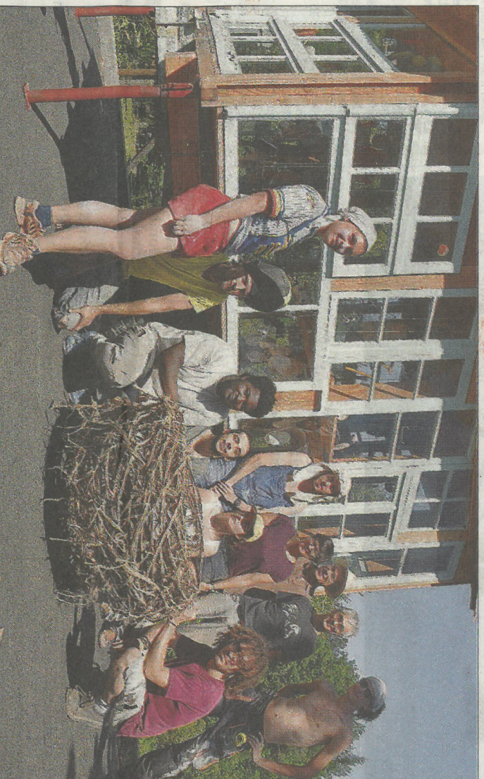
LES ARTISTES. Pour préparer leur projet du musée éphémère, les étudiants de l'Ensa et les habitants de la commune (au total 55 personnes) sont partis visiter le Musée d'arts modestes à Sète le 17 novembre 2018.